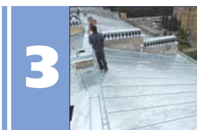
В 23 домах района к зиме капитально отремонтируют кровли