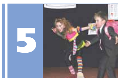
Детский театр «Веселый балаганчик» покоряет зрителей