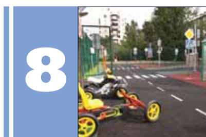
8 В детском саду № 31 появился современный автогородок