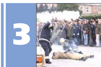
3 Пожарная охрана Московского района отпраздновала день рождения