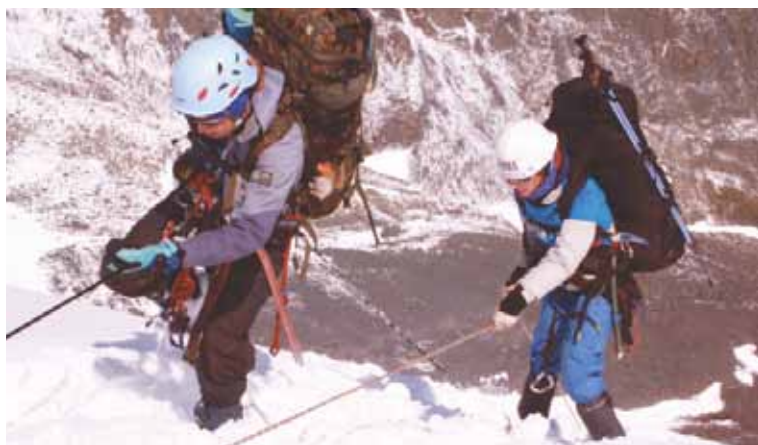
● Школьники штурмуют не только искусственные скалы