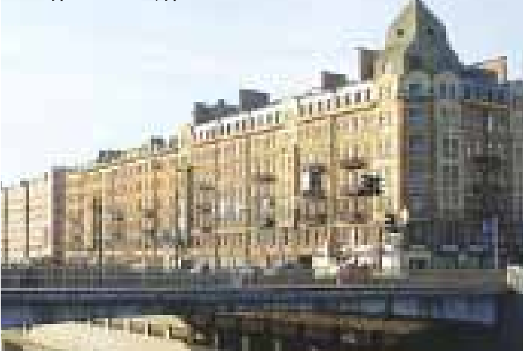
Обводный канал, д. 60

гистралью, однако предпочтение было отдано проекту реконструкции, в ходе которой канал и приобрел современный вид.