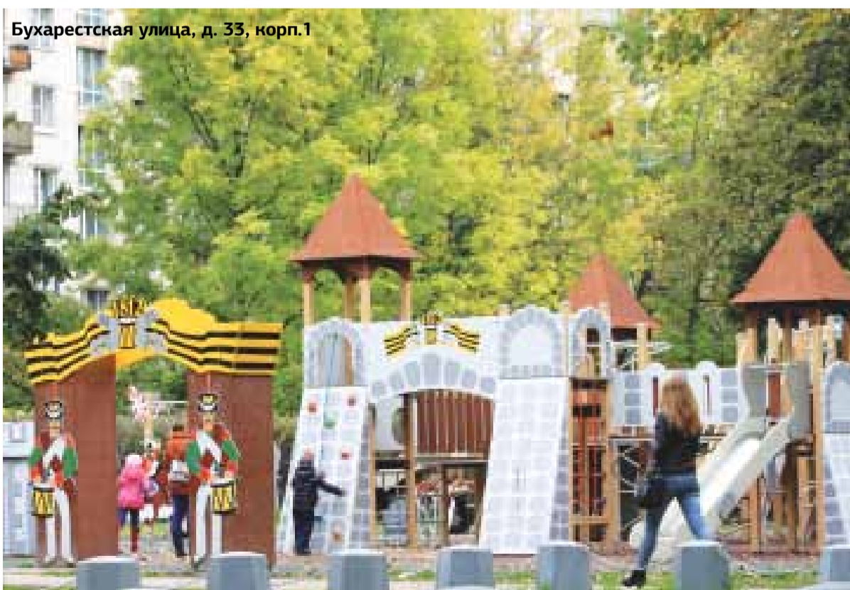
Бухарестская улица, д. 33, корп. 1