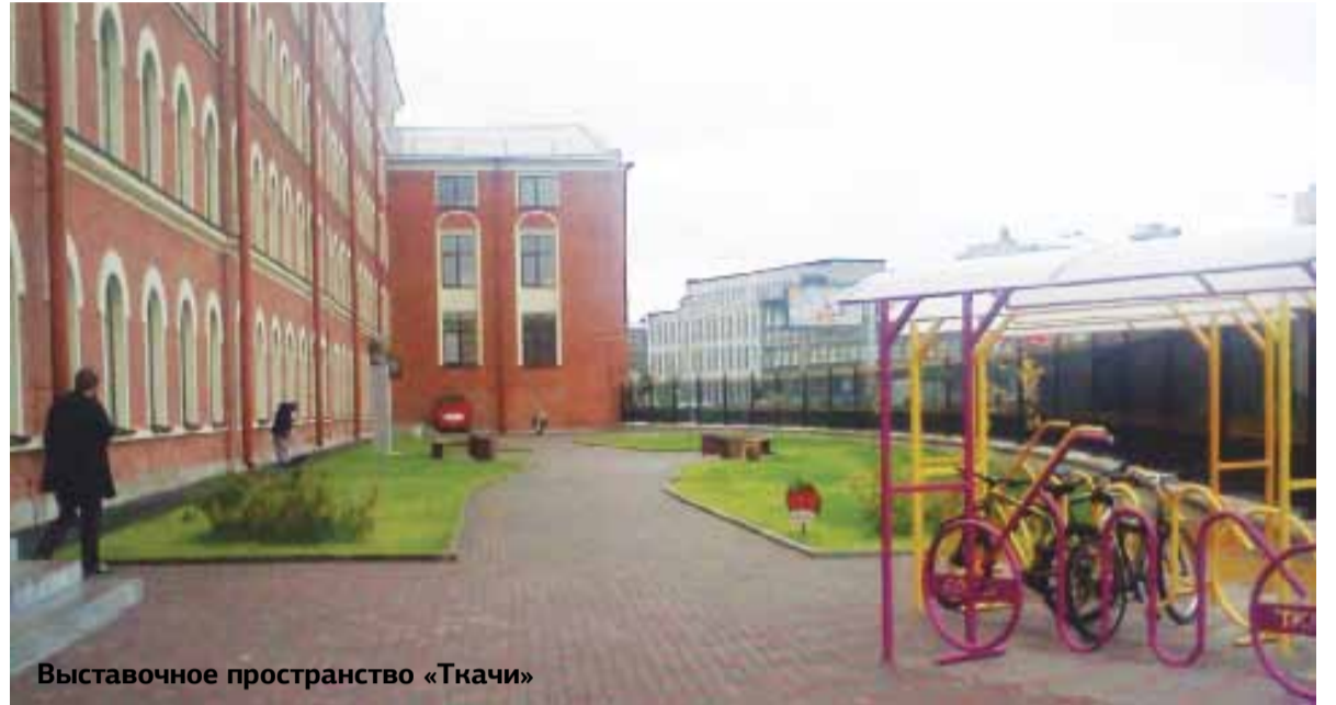
Выставочное пространство «Ткачи»

Фрунзенский район выставляет на городской конкурс самые