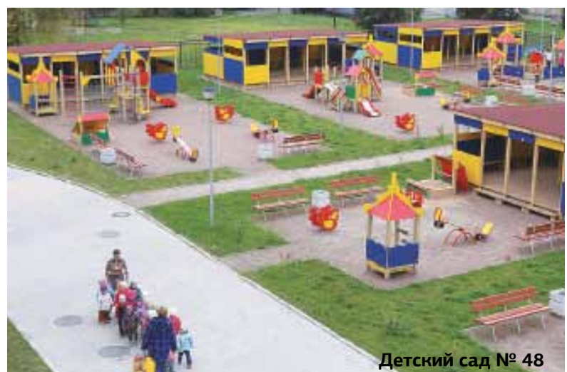
Детский сад № 48