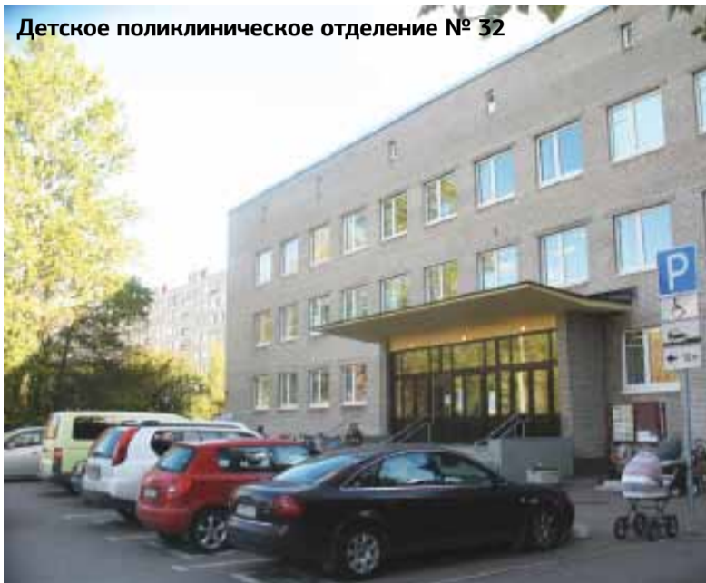
Детское поликлиническое отделение № 32

городской программой развития физической культуры и спорта.