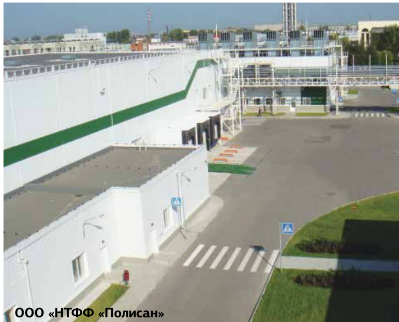
ООО «НТФФ «Полисан»