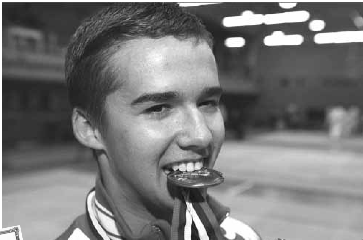
■ Москва. Коллонтаево. Чемпионат России