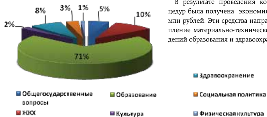
Структура расходов бюджета Фрунзенского района на 2013 год

Наиболее значимые объемы ассигнований были направлены на развитие образования, здравоохранения, социальной сферы и повышение качества жилищного фонда.