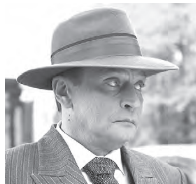
КАДР ИЗ ФИЛЬМА «РИХАРД ЗОРГЕ»