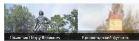
Памятник Петру Великому

Муниципальное образование город Кронштадт