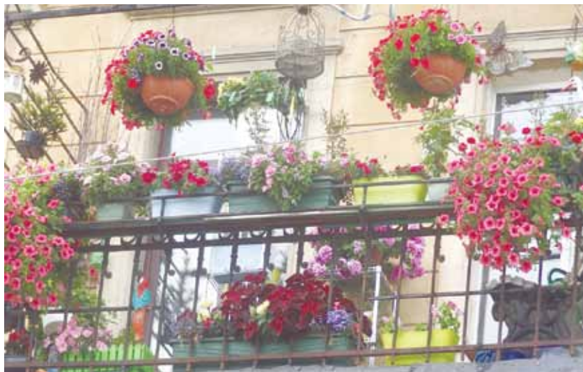
Победитель в номинации «Лучший балкон» (2016 год)

Местная Администрация внутригородского Муниципального образования Санкт-Петербурга муниципального округ Лиговка-Ямская напоминает, что продолжается прием заявок на лучшее оформление балконов, клумб, цветников на придомовых и дворовых территориях внутригородского Муниципального образования Лиговка-Ямская «Лучшая клумба (балкон)».