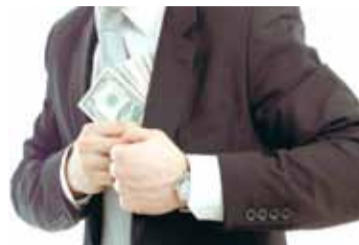
Не обращайтесь к псевдоюристам!