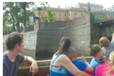
Теплоходные экскурсии: особенный Петербург