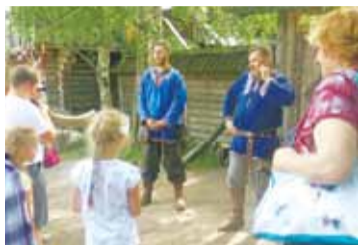
Викинги, или Путешествие в Средневековье