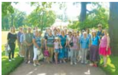
Александрия — собственная дача императрицы