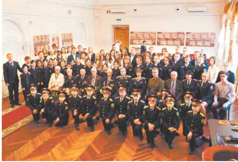
Встреча с ветеранами в ГСУ В День Победы

В этом году школа получила обновленное здание, ремонт длился четыре года, на открытии учащихся приветствовал губернатор Санкт-Петербурга Георгий Сергеевич Полтавченко, а осенью здесь ждут в гости председателя Следственного комитета Александра Ивановича Бастрыкина. С высшим ведомством кадет объединяют не только тесные взаимоотношения и преподаватели, которые читают в школе профильные предметы, но и форма — она такая