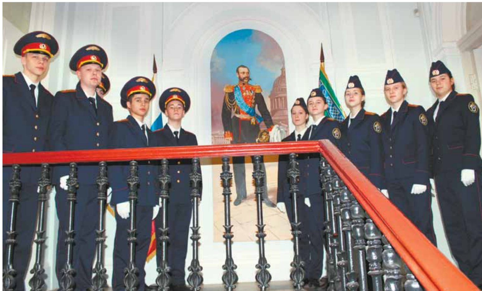
Учащиеся школы № 304 Центра подготовки кадет на торжественной церемонии

Особенная школа № 304 расположена на территории Муниципального образования Лиговка-Ямская. Это единственное в России учебное общеобразовательное учреждение, где ребята не просто обучают общеобразовательным предметам, но одновременно в Центре подготовки кадет дают правовые знания и дисциплинарную основу.