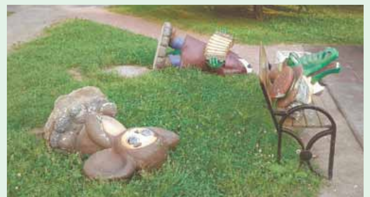
Акт вандализма на Советской улице

Как же достучаться до людей, как разъяснить, что известное выражение про красоту, призванную спасти мир, актуально во все времена? Кто защитит красоту от вандализма? И где совесть, стоящая у истоков нравственности и гуманного отношения ко всему, что нас окружает? Эти вопросы, увы, пока остаются без ответа.