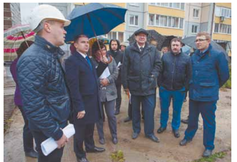
На месте строительства многоквартирного жилого дома на ул. Красных Партизан