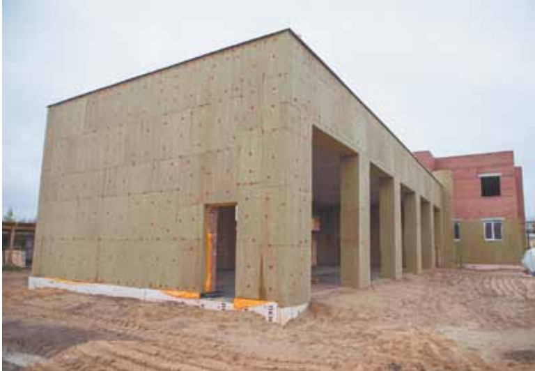
Здание будущей станции скорой помощи