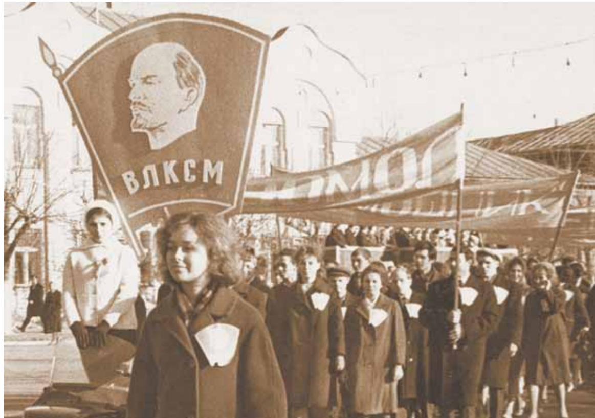
Комсомольцы 60-х на демонстрации

Быстротечно время. Казалось бы, еще совсем недавно гремели по нашей огромной стране ударные комсомольские стройки: возводились новые города, прокладывался БАМ, осваивались необъятные просторы казахстанской целины... Комсомольцы — люди особого склада характера — оказывались на первых рубежах. Сегодня нет уже ни той страны, ни той организации. Даже Иосифа Кобзона, прекрасно исполнявшего песню «Комсомольцы-добровольцы», не стало. Но остались люди, помнящие и любящие те времена. 29 октября они отметят столетний юбилей ВЛКСМ.