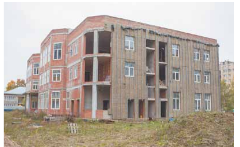
Детский сад на 185 мест с бассейном в поселке Металлострой