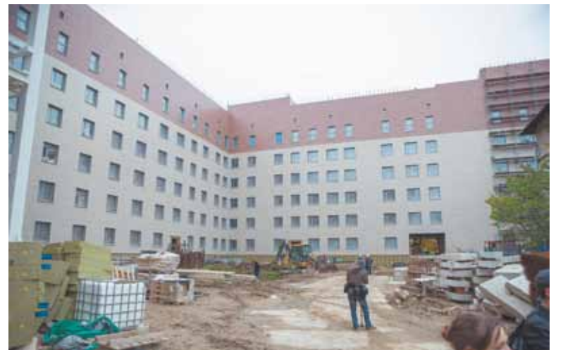
Городская больница № 33