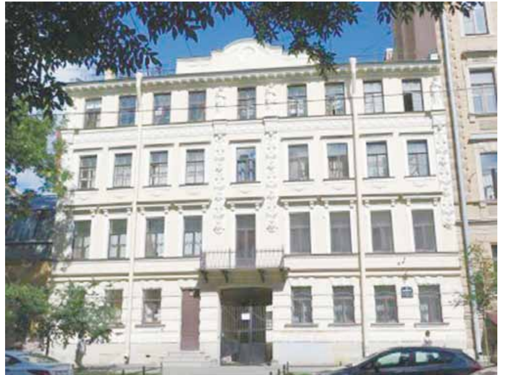
5-я линия В. О., д. 16

На пике творческого роста и славы Архип Иванович перестал показывать собственные произведения. Годы затворничества, проведенные в мастерской, стали для художника временем уединения и полной отдаленности от мира тщеславия. Однажды молодые художники не выдержали и попросили его показать свои