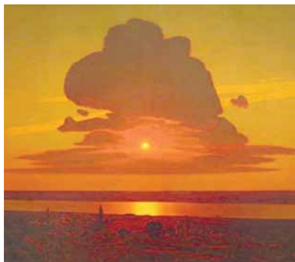
А. И. Куинджи. Красный закат. 1905-1908 гг.