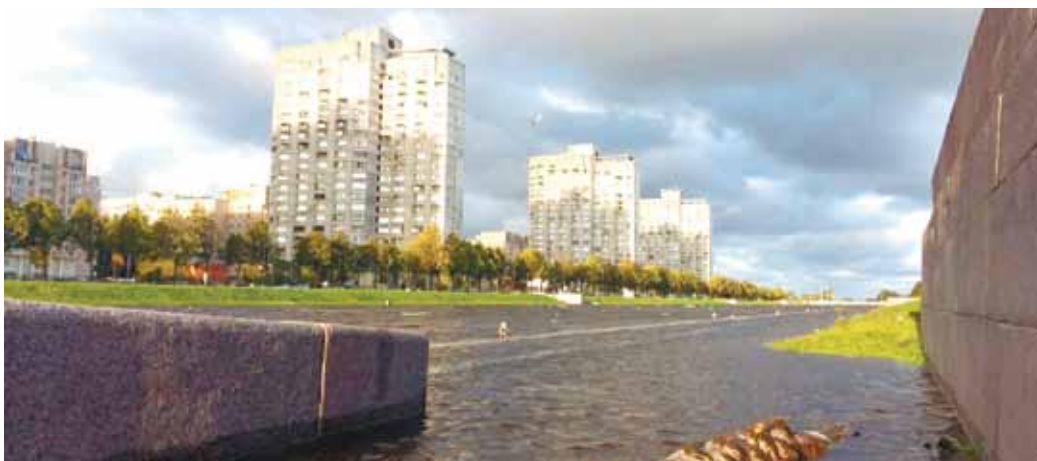
В Петербурге ливни привели к разливу реки Смоленки. Вышедшая из берегов вода дважды подтопила набережную на Васильевском острове