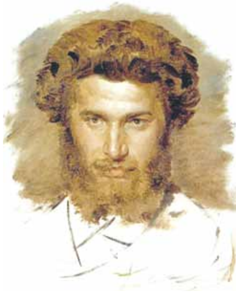
В. М. Васнецов. Портрет художника А. И. Куинджи. 1869 г.

В конце 1880-х годов Архип Иванович решает купить дом, достаточно высокий, чтобы с его крыши были видны и набережная, и Нева, и линии Васильевского острова. Дом значился под номером 43 по 10-й линии. «Я уже знаю, что с этой крыши будет далеко видно, — рассказывал потом Куинджи. — Смотрю — весь город как на ладони... И куда ни глянешь — не оторвать глаз... Здесь такие этюды можно писать. Это же такая мастерская и такие виды, каких нигде нет...» Так художник стал владельцем домов № 43, 41 и 39, принадлежавших одному владельцу. Хозяйство было хлопотным и накладным. Художник сам занимался всеми ремонтными работами. И постепенно начал сдавать квартиры. А на крыше своего дома разбил сад, куда слетались птицы. Перу ученика Куинджи Николая Рериха принадлежат следующие строки: «Мощный Куинджи был не только великим художником, но также был великим Учителем жизни. Его частная жизнь была необычна, уединенна, и только ближайшие его ученики знали глубину души его. Ровно в полдень он всходил на крышу дома своего, и, как только гремела полуденная крепостная пушка, тысячи птиц собирались вокруг него. Он кормил их из своих рук, этих бесчисленных друзей своих: голубей, воробьев, ворон, галок, ласточек. Казалось, все птицы столицы слетелись к нему и покрывали его плечи, руки и голову. Он