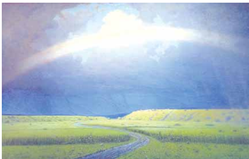
А. И. Куинджи. Радуга. 1900-1905 гг.